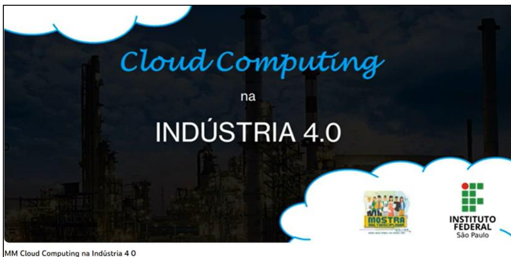
Figura 3 – Trabalho apresentado pelos alunos no formato de vídeo na era pandêmica.

A Mostra Multi possui um site ( https://www.mostramult.com/ ) com todas as informações referentes ao evento como, inscrições, submissões, dentre outros.