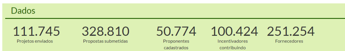
Figura 2 – Dados do Sistema de Apoio às Leis de Incentivo à Cultura

Fonte: Versalic - http://versalic.cultura.gov.br/#/home . Acessado em 25/09/2023